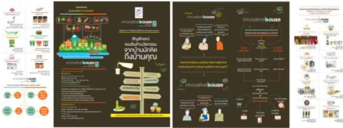
ภาพที่ ๑ แสดงโบชัวร์ของหน่วยงานที่แสดงรูปแบบและโทนสีสำหรับอ้างอิงในการออกแบบ

ลักษณะงาน ดำเนินการจัดสร้างและตกแต่งคูหาตามพื้นที่จัดแสดงต่างๆ ผู้รับจ้างจะต้องดำเนินการเสนอแนวคิด (concept) และรูปแบบการจัดงาน (Theme) การออกแบบก่อสร้าง และตกแต่งสถานที่จัดงาน ตามแนวทางการออกแบบของโบชัวร์ของชุดโครงการฯ ตามภาพที่ ๑ คูหาจัดแสดงและจำหน่ายสินค้า โดยออกแบบและวางผังบริเวณ (Lay Out) ของงานให้สอดคล้องกับการใช้พื้นที่ โดยคำนึงถึงความสวยงาม สะดวกต่อการใช้งาน เหมาะสมและสอดคล้องกับรูปแบบการจัดงาน ทำให้งานสมบูรณ์มากที่สุด โดยการก่อสร้าง และตกแต่งจะต้องเสร็จก่อนเวลาเปิดงาน ส่วนการรื้อถอนจะต้องให้เสร็จภายในเวลาที่กำหนด ทั้งนี้ ผู้รับจ้างจะต้องเป็นผู้รับผิดชอบค่าใช้จ่ายต่างๆ ที่เกิดขึ้นดังนี้