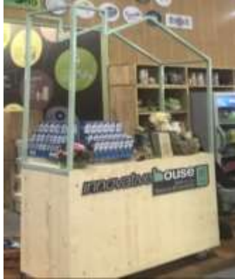
ภาพที่ ๗ Counter ผู้ประกอบการ สกว.