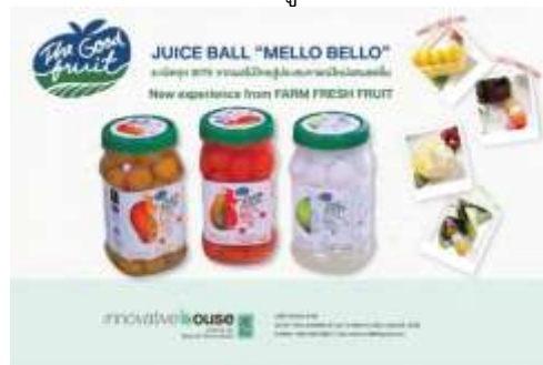
ภาพที่ ๘ ตัวอย่างป้ายอธิบายผลิตภัณฑ์จากงานวิจัย