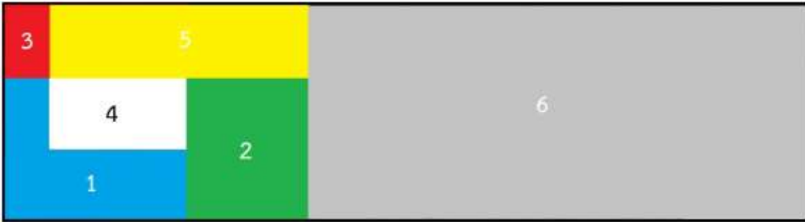
ภาพที่ ๓ แสดงพื้นที่รวมของโครงสร้างภายในงาน

๔. พื้นที่รวม ๑๒๖ ตารางเมตร แบ่งพื้นที่เป็น ๖ ส่วน ตามวัตถุประสงค์ของพื้นที่ (ตามภาพที่ ๓)