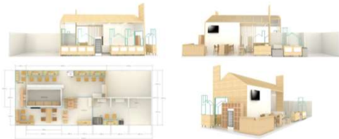
ภาพที่ ๒ แสดงโครงสร้างคูหาจากงาน Thai Fex ๒๐๑๗